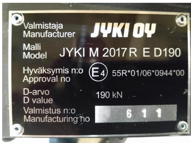
Kuva 3. Vetoaisan tyypikilpi